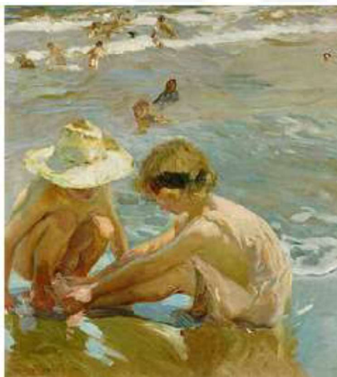
El pie herido.

Este trabajo recibió el Grand Prix y una medalla de honor en la exhibición Universal en París en 1900, y la medalla de honor en la Exhibición Nacional de Madrid en 1901. Tras este éxito, dedicó gran parte de su trabajo a pintar escenas de la gente y el mar de Valencia, dotadas de gran luminosidad. (3,11) Entre estos trabajos en contraste, se encuentran una numerosa colección de escenas de niños en la costa de Valencia. (12)