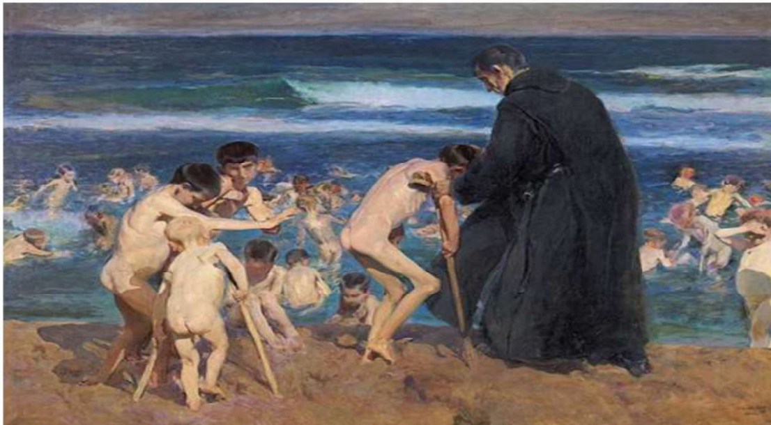
Imagen tomada de Benjamin J. y cols. Art and Pediatric Orthopaedics: Sorolla and a Sad Inheritance. J Pediatric Orthop 2021;41:e590–e591 (10)

hay otro que está de frente y que parece tener las cuencas oculares vacías o con microftalmia importante, debió ser parte de los niños atendidos en un asilo y también da pie a ejercicio diagnóstico múltiple.