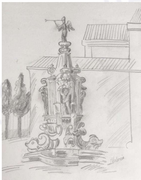
Autor del dibujo: José Martín Valencia

En la narración también se tocan la drogadicción, las relaciones familiares problemáticas, inseguridad de los adolescentes y la expresión artística como catalizador de las emociones.